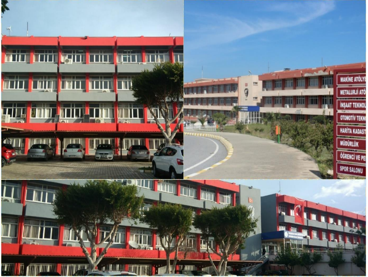
Resim 4. İskenderun MYO Onarım ve Tadilat Çalışmaları