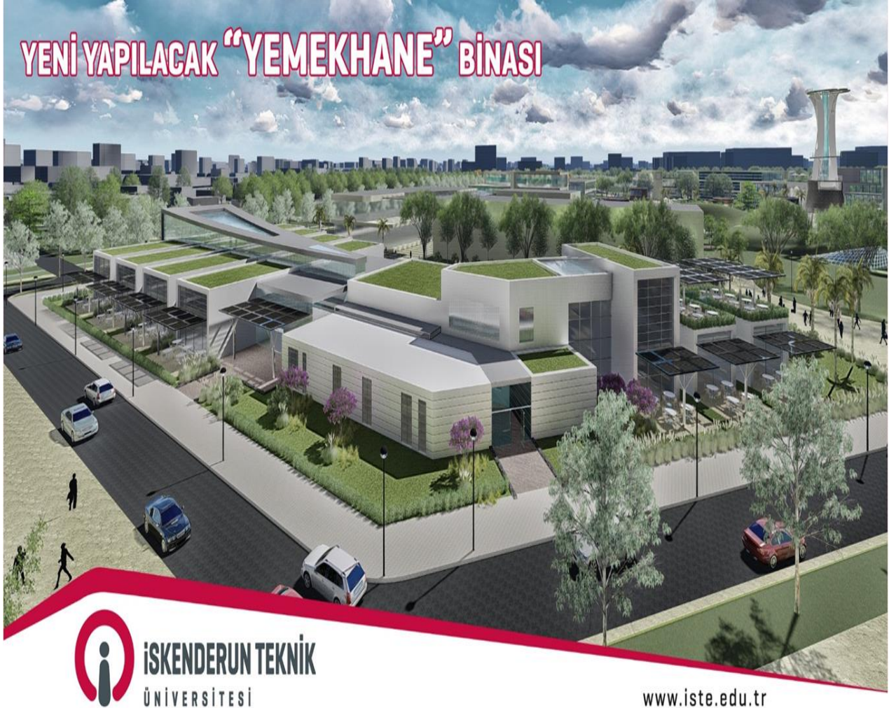
Resim 3. Merkezi Yemekhane