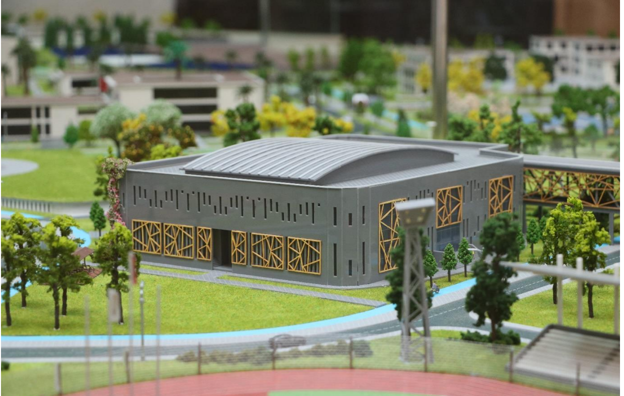
Resim 5. Kapalı Spor Kompleksi