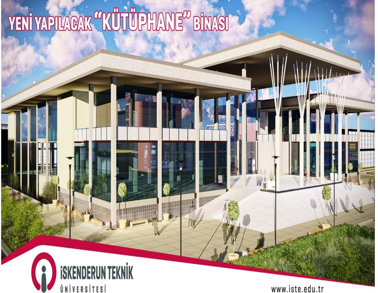
Resim 2. Merkezi Kütüphane