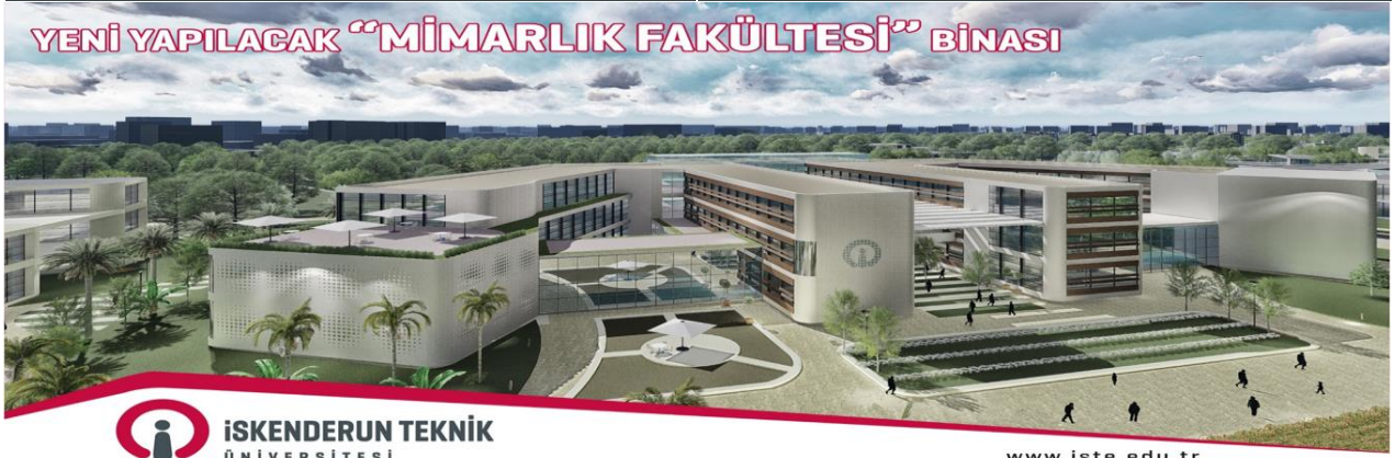
Resim 1. Mimarlık Fakültesi