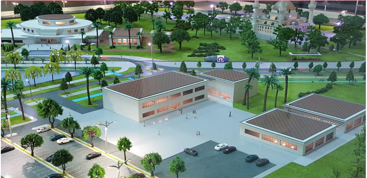
Resim 6. Necla Üysen Mediko-Sosyal Hizmet Binası