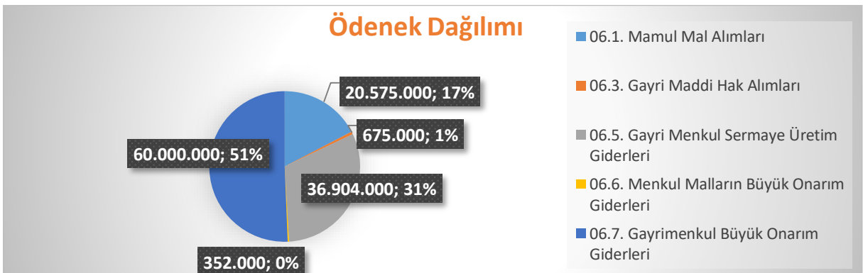
Grafik 2. 2023 Yılı Yatırım Projeleri Ödenek Dağılımı