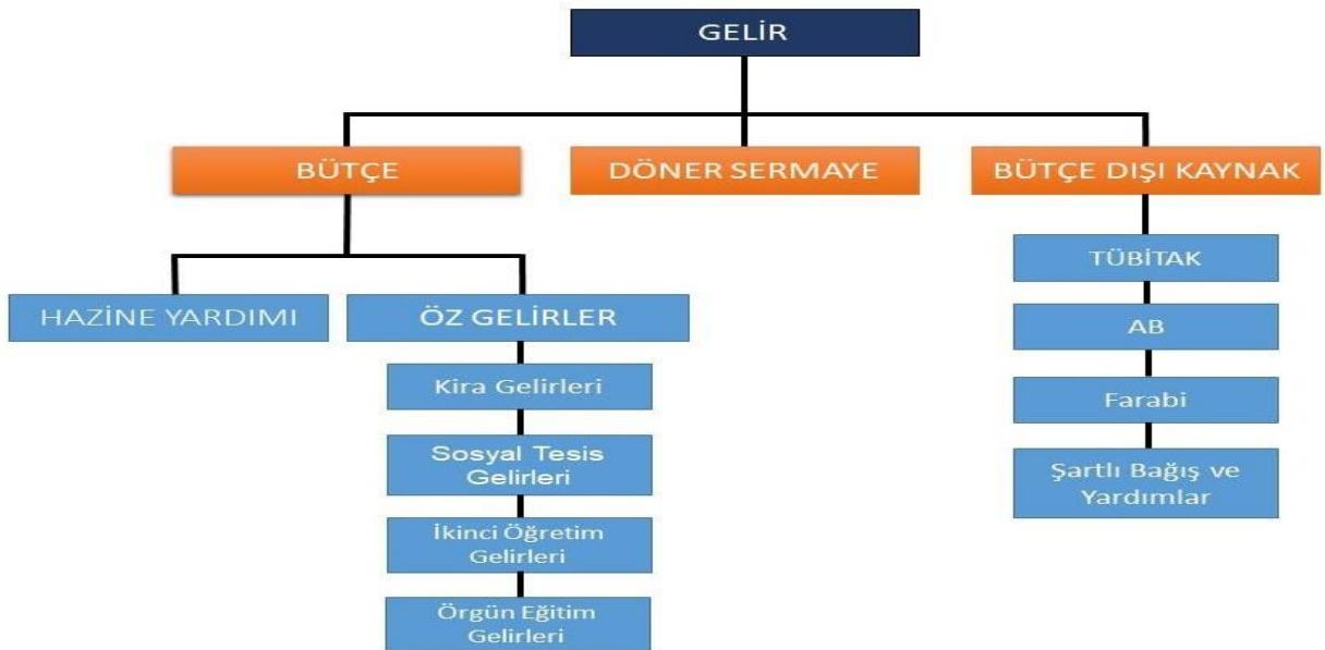
Şekil 1. Finansman Kaynakları

Üniversitemiz, 5018 Sayılı Kanun'a ekli II Sayılı Özel Bütçeli İdareler Cetvelinin A bendinde Yükseköğretim Kurulu, Üniversiteler ve Yüksek Teknoloji Enstitüleri içerisinde sayılan, "Özel Bütçeli" bir kurumdur.