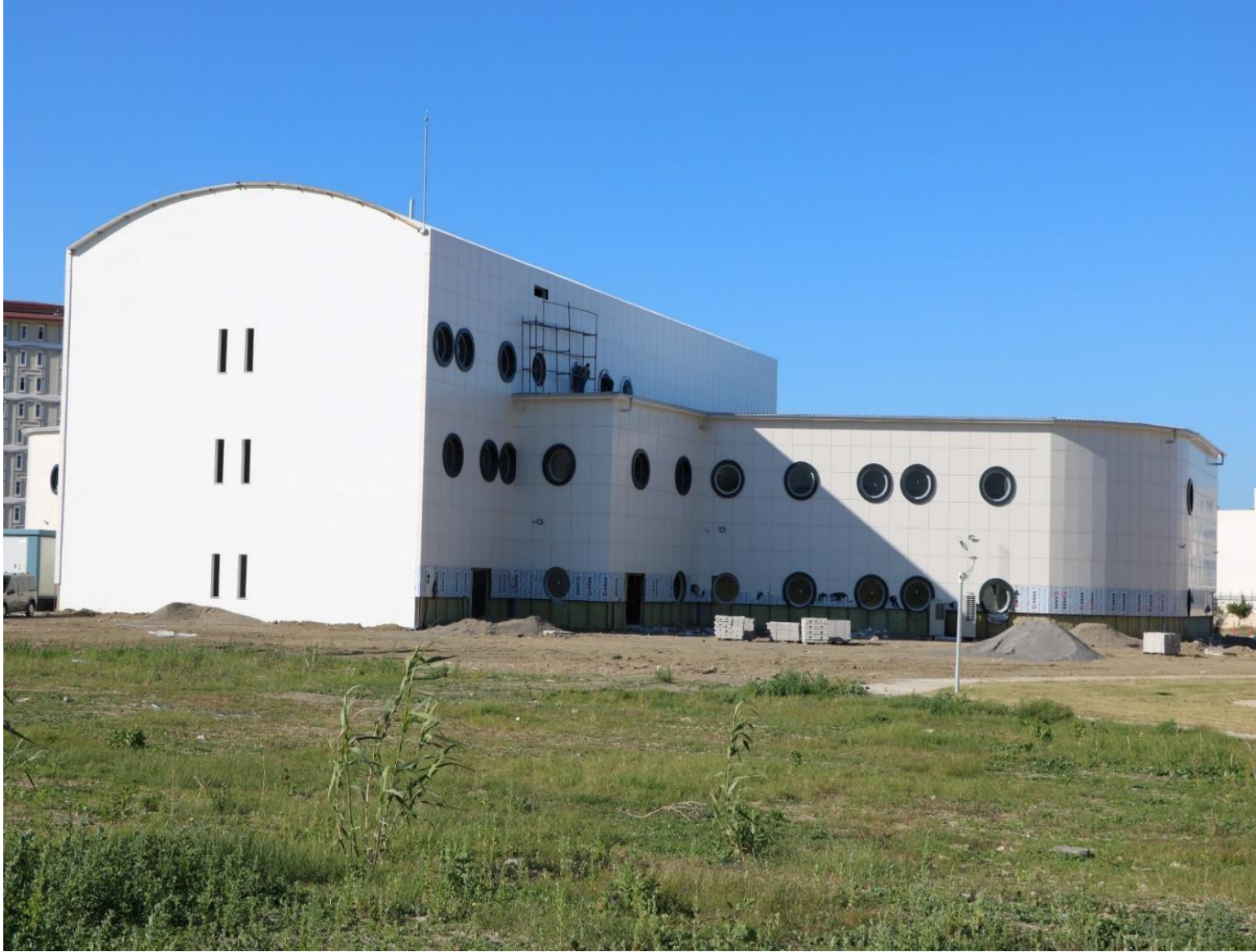
Resim 1. Hangar ve Atölyeler Binası