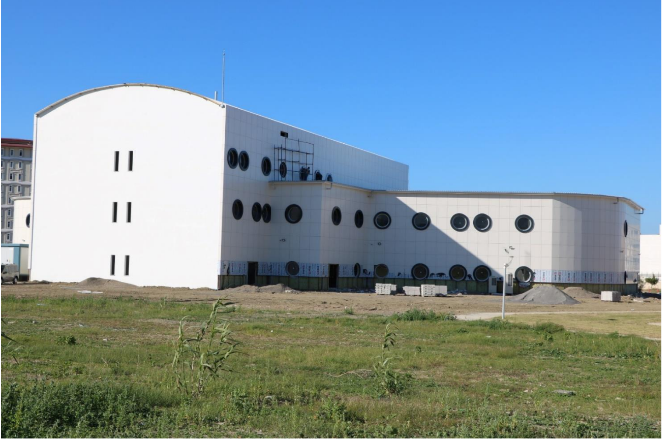
Resim 1. Hangar ve Atölyeler Binası