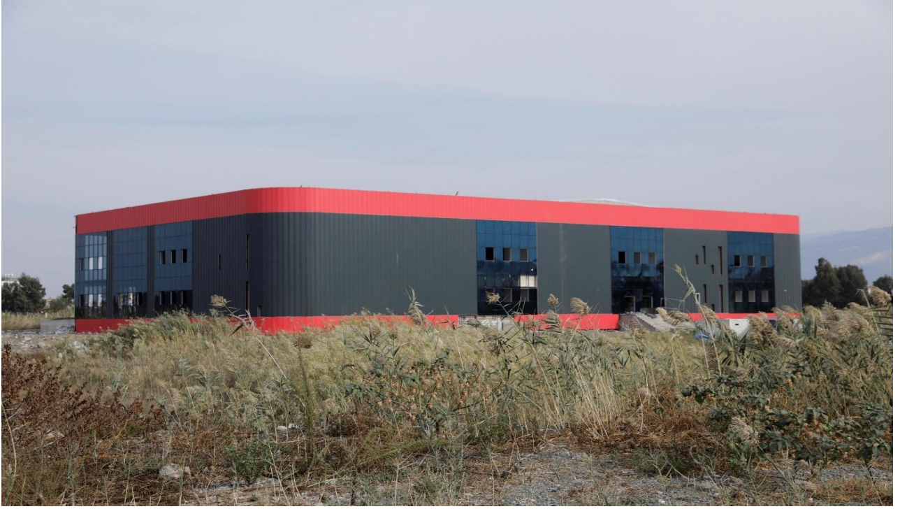
Resim 2. Kapalı Spor Kompleksi