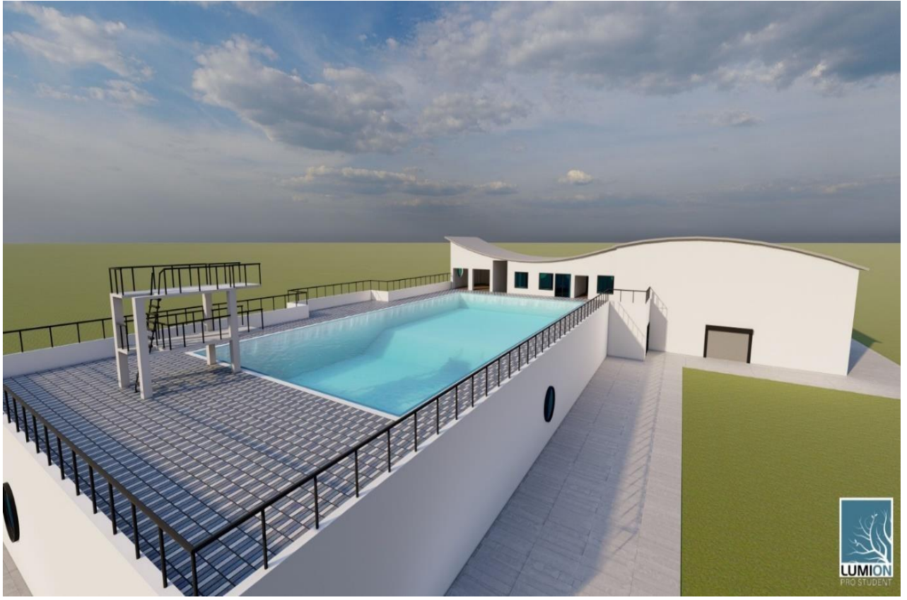
Resim2. Gemi Adamları ve Kılavuz Kaptanlar Eğitim Merkezi