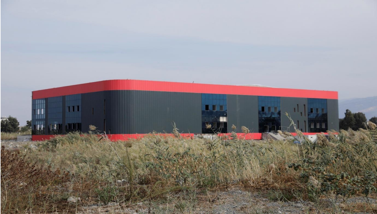
Resim 4. Kapalı Spor Kompleksi