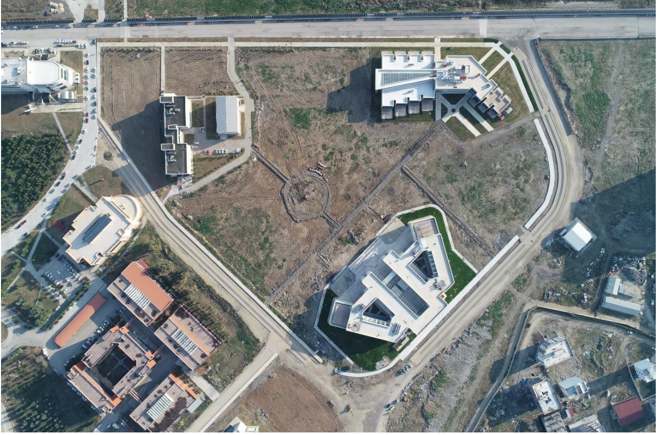
Resim 1. Mimarlık Fakültesi