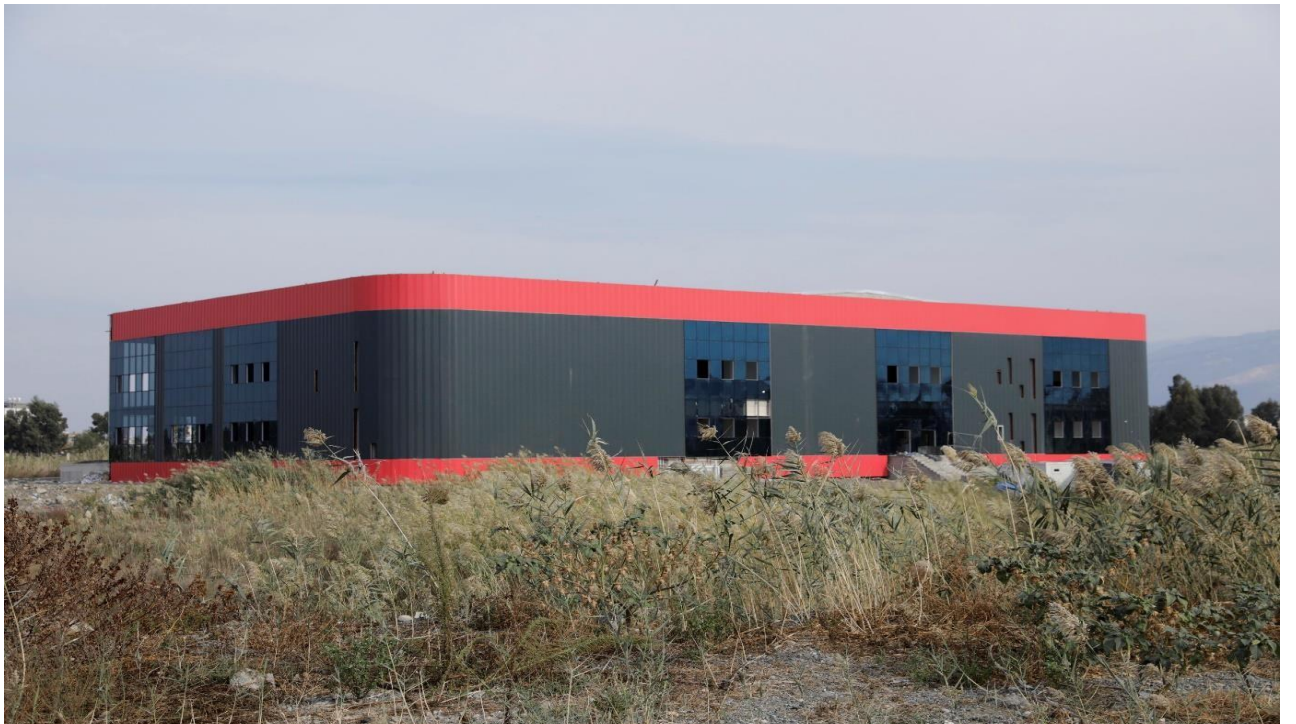
Resim 4. Kapalı Spor Kompleksi