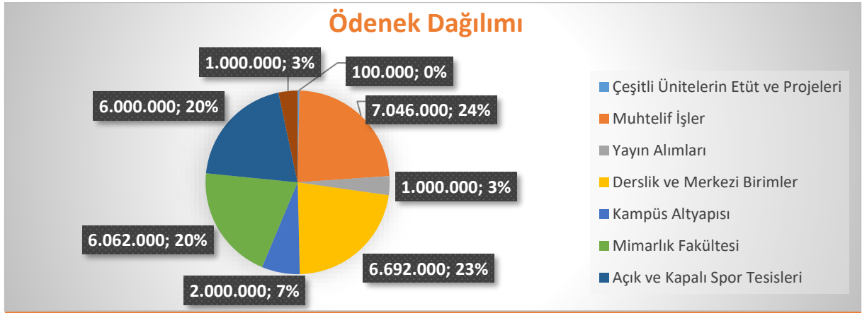
Grafik 1. 2021 Yılı Yatırım Projeleri Ödenek Dağılımı

Üniversitemizin 2021 yılı yatırım harcamalarının bütçe verilerine göre dağılımı Tablo 2'de gösterilmiştir.