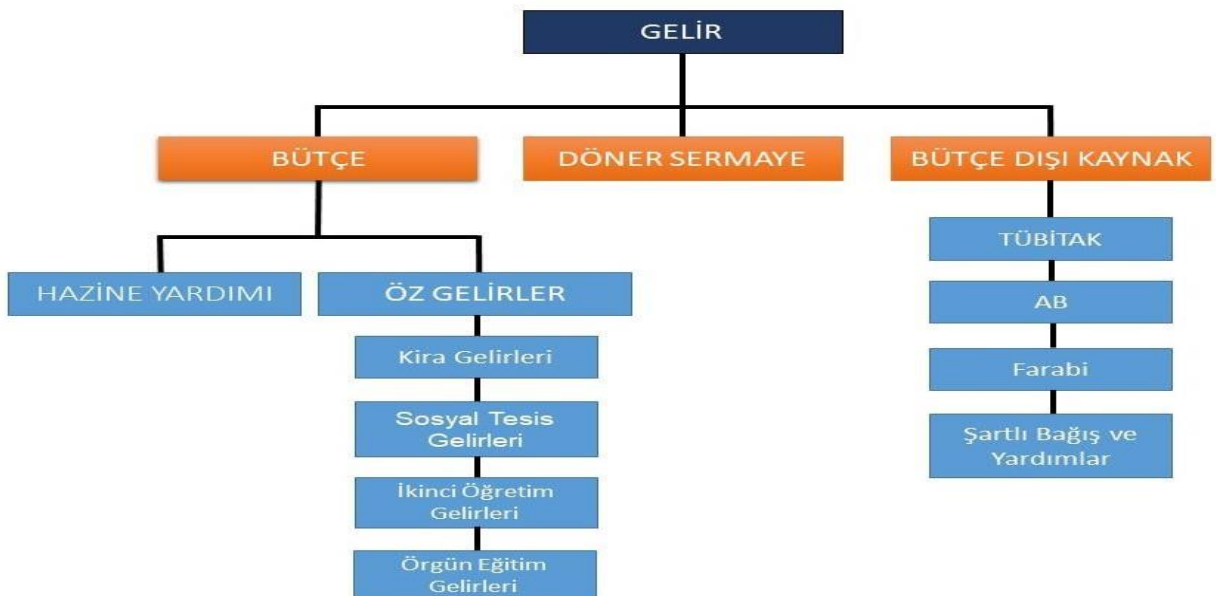
Şekil 1. Finansman Kaynakları

Üniversitemiz, 5018 Sayılı Kanun'a ekli II Sayılı Özel Bütçeli İdareler Cetvelinin A bendinde Yükseköğretim Kurulu, Üniversiteler ve Yüksek Teknoloji Enstitüleri içerisinde sayılan, "Özel Bütçeli" bir kurumdur.