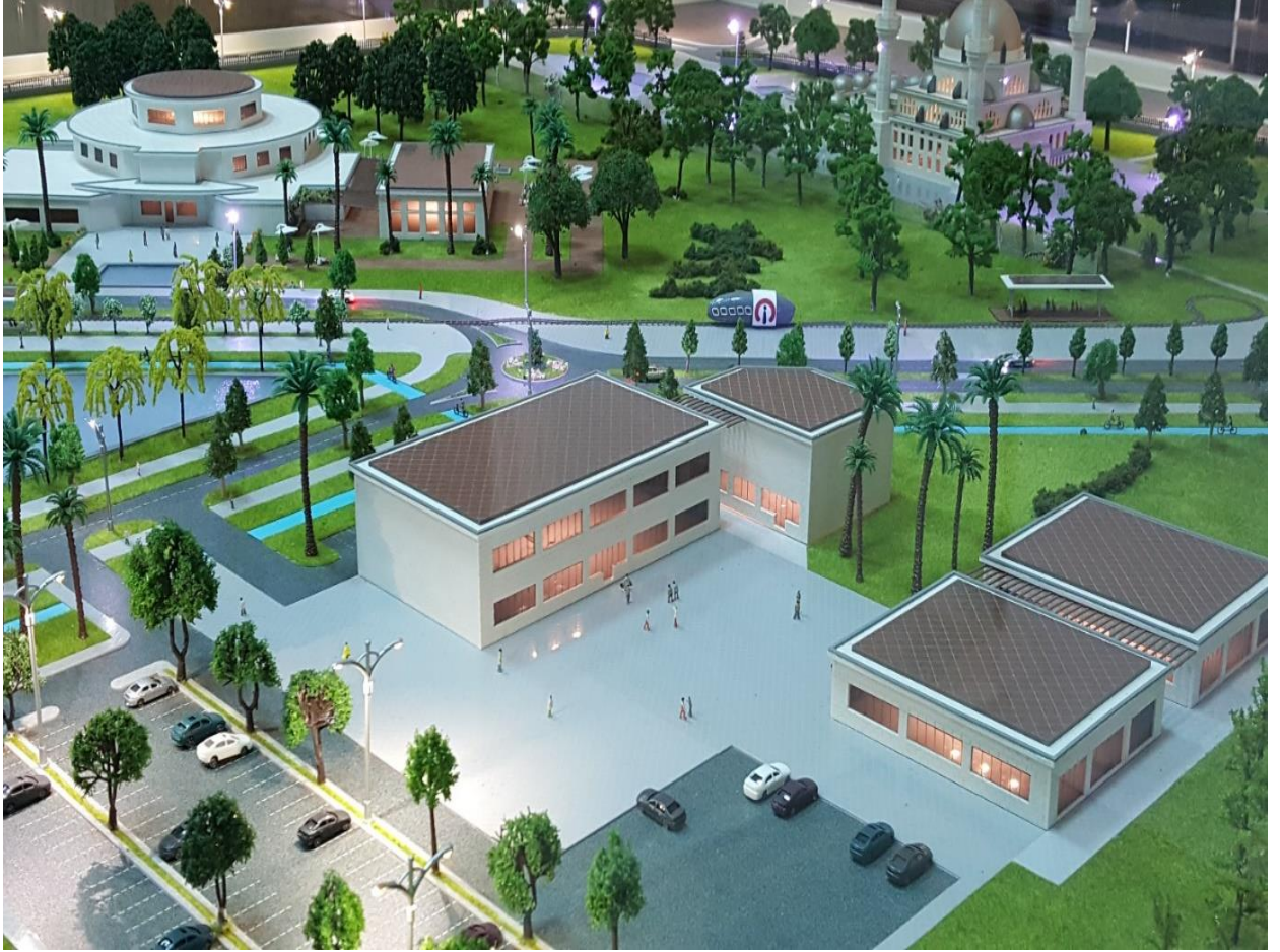
Resim 6. Necla Üysen Mediko-Sosyal Hizmet Binası