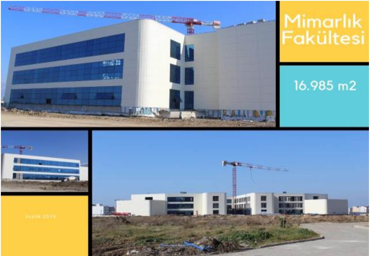
Resim 1. Mimarlık Fakültesi