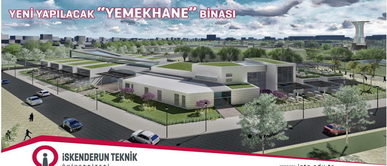
Resim 3. Merkezi Yemekhane