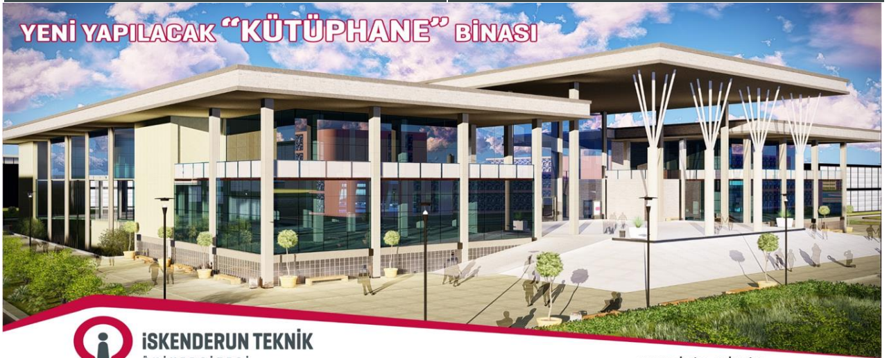
Resim 2. Merkezi Kütüphane