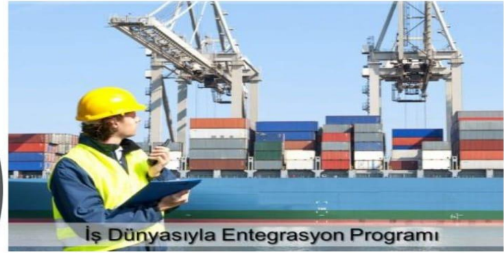
İş Dünyasıyla Entegrasyon Programı