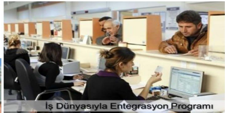
İş Dünyasıyla Entegrasyon Programı