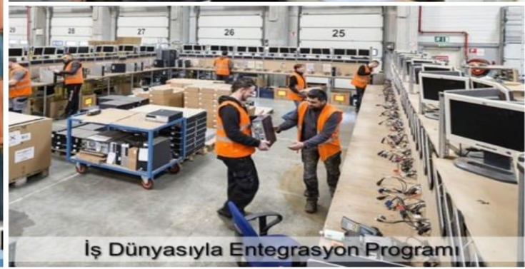
İş Dünyasıyla Entegrasyon Programı