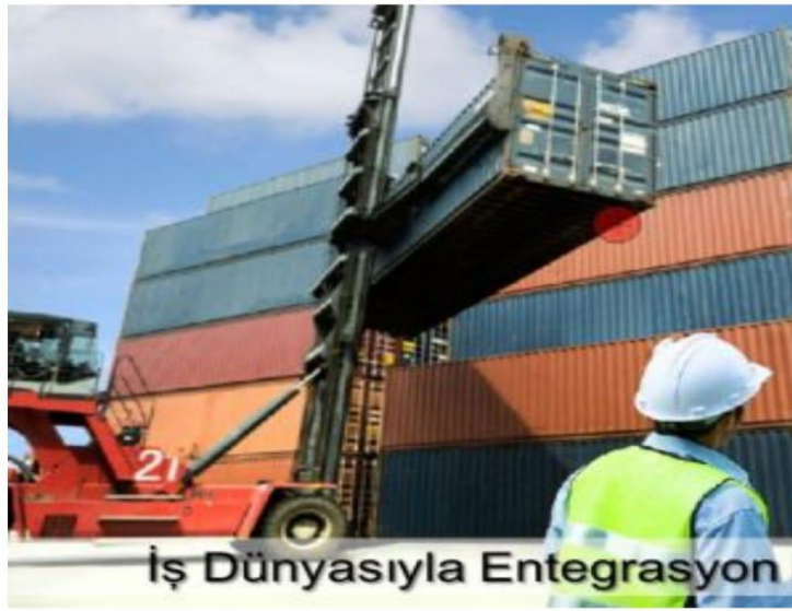
İş Dünyasıyla Entegrasyon